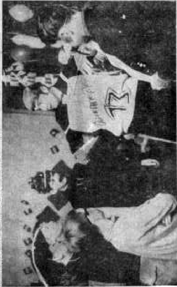
Querschnitt über die Aktion. Die Jungen vom Knabenheim Loherschocken hatten hellere Farbe. Nüsse zu kneten.